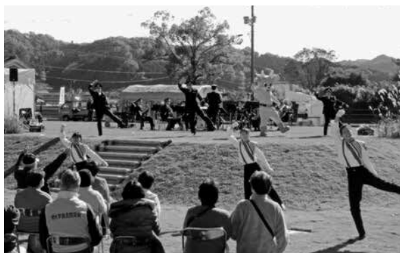
▲前回：音楽隊コンサート