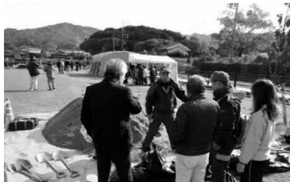
▲前回：土のうづくり体験(村消防団)