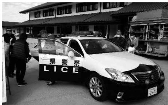
▲前回：警察・消防・自衛隊の車両展示