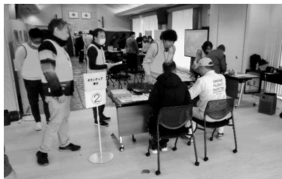
▲前回：災害ボランティアセンター