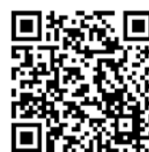
▲洪水・土砂災害ハザードマップ（抜粋） ▲明日香村HP