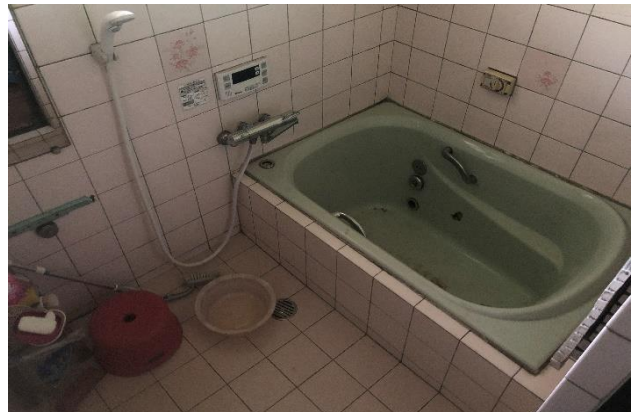
( お風呂 )