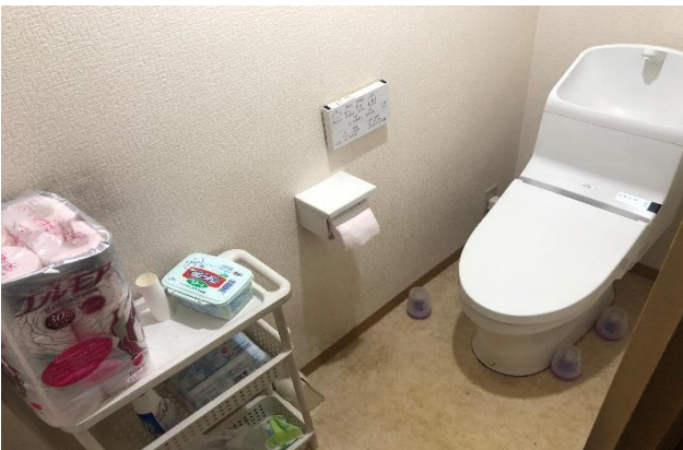
( トイレ )