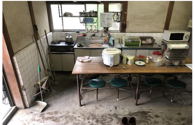
( ダイニングキッチン )