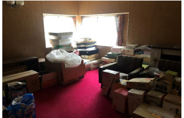
( 応接間 )