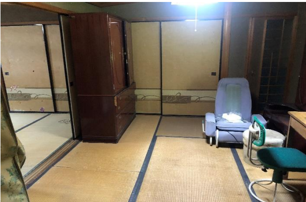
( 和 室 )