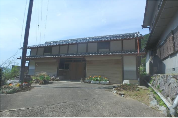
( 外 観 )