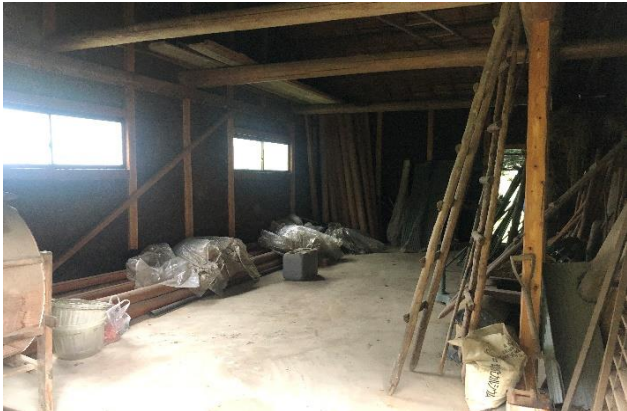
( 材木庫 )