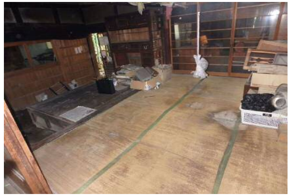
( 6 畳和室 )