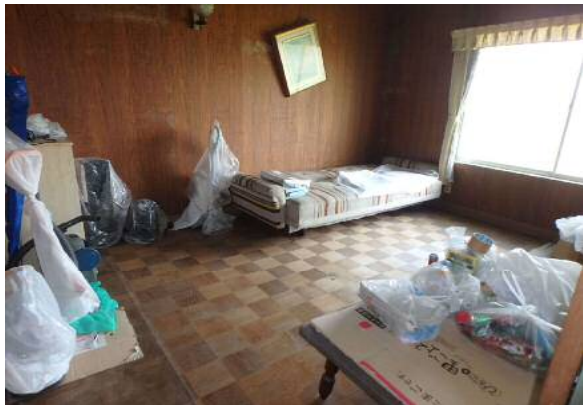
( 応 接 間 )