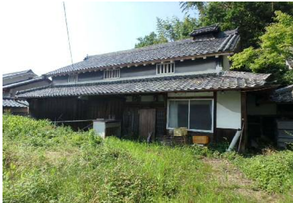
( 外 観 )