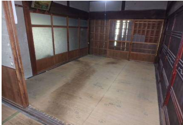
( 6 畳和室 )