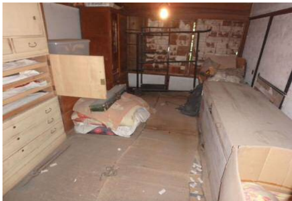
( 6 畳和室 )