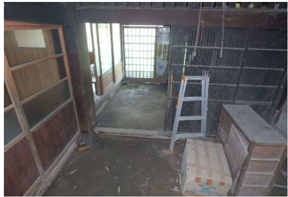
( 土 間 )