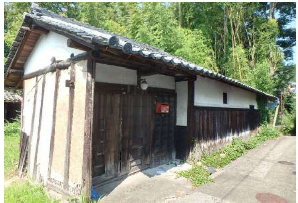
( 外 観 )