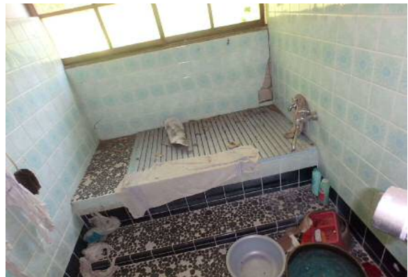
( お 風 呂 )