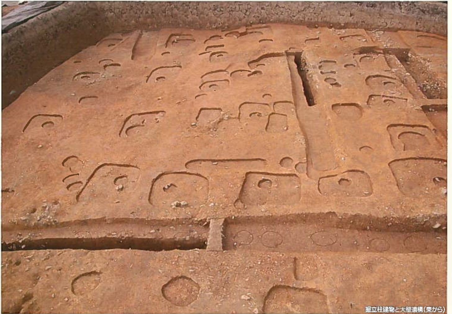
掘立柱建物と大壁遺構(東から)