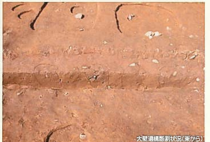
大壁遺構断面剖状況(東から)