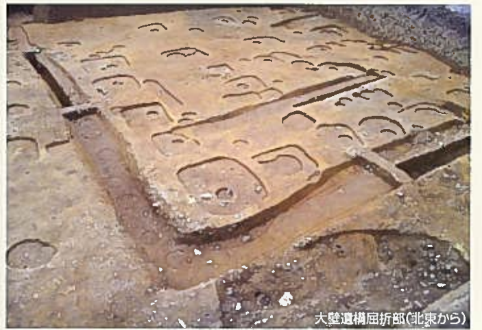
大壁遺構屈折部(北東から)