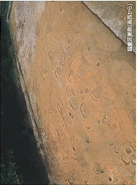
調査区東側(南西から)