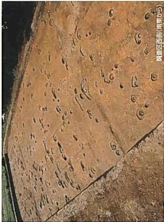
調査区西側(南東から)