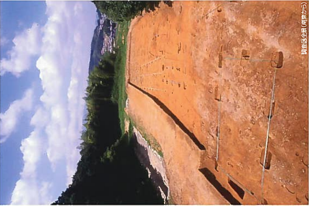
調査区全景(南東から)