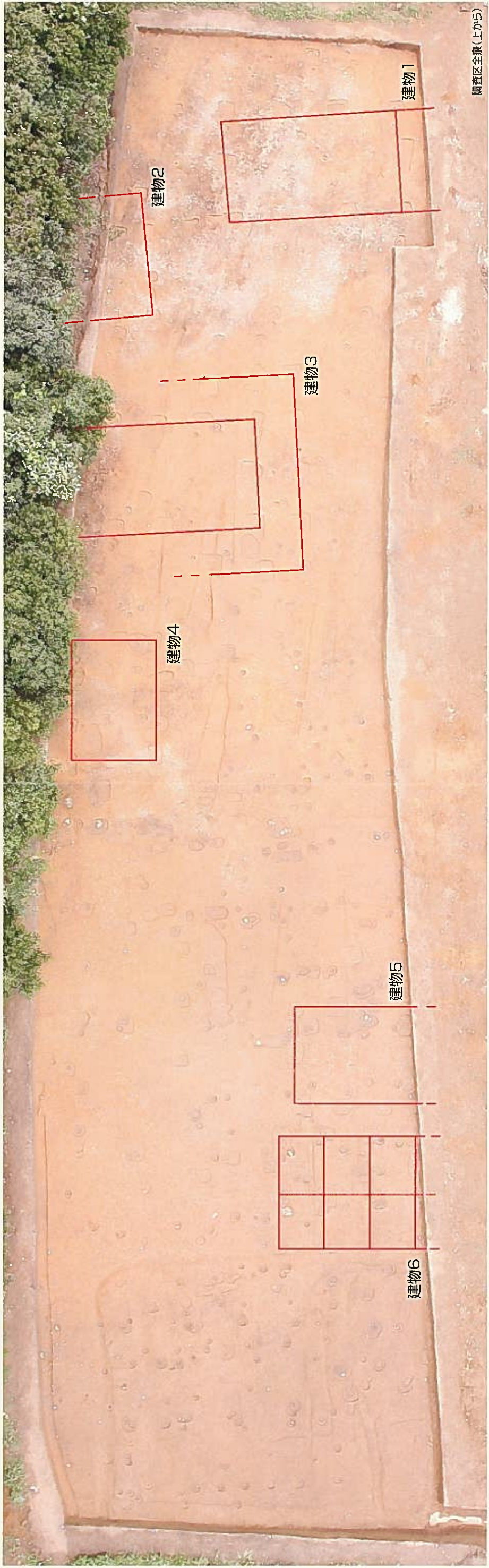
調査区全景(上から)