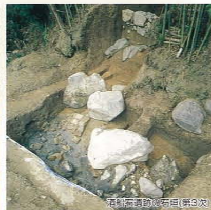
酒船石遺跡の石垣(第3次)