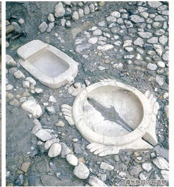
雨水施設の石造物