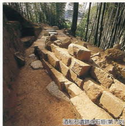
酒船石遺跡の石垣(第1次)