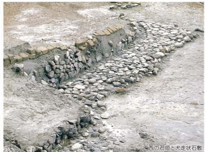
西の石垣と犬走状石敷