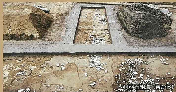
1区 石組溝 (東から)