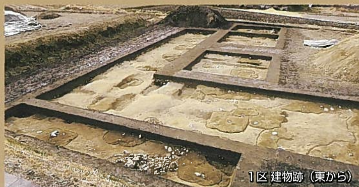
1区 建物跡 (東から)