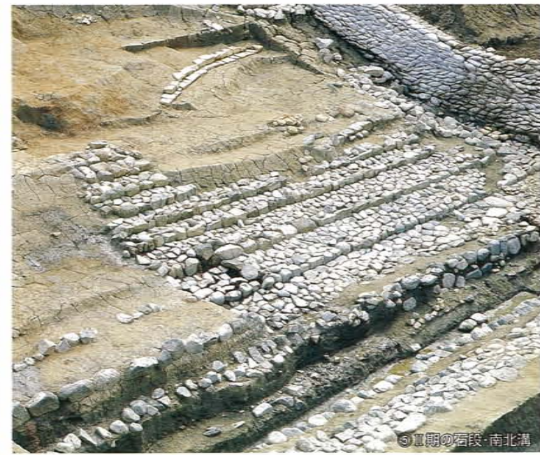
⑤ 1期の石段・南北溝