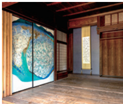
〈くノノイエ〉プロジェクト 襖絵「山に抱かれたものたち」 展示風景(熊野市神川町神上集落、2016年)