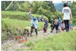
毎年100人以上が参加する棚田の田植えまつり (細川にて)