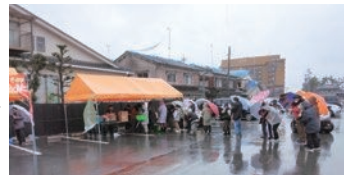
雨の中炊き出しに列をなす被災者のみなさん (3/20和倉温泉にて)

答 公助の面で道路・水道などのインフラの復旧や避難所の受け入れ体制の見直しとともに、体育館に空調設備などの整備を進めます。また、防災計画とともに災害廃棄物処理計画や急傾斜地崩壊対策・浸水対策の見直しや策定を進めていきます。