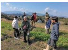
野菜づくりの畑回り勉強会

②耕作放棄農地を減らして、世界遺産登録をめざす村にふさわしい景観づくりを進めるために、多様な農の担い手に村独自の支援強化を。