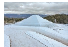
雪景色の牽牛子塚古墳

古都法の買入れ地の多くが耕作放棄地となっている。県や国に対して利活用の徹底を求める