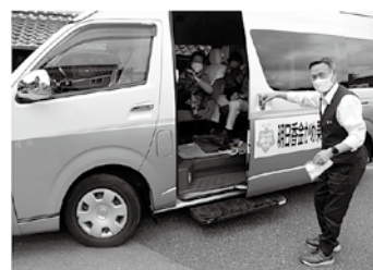
【金かめ乗合交通でスーパーまで】

毎日、家の中にいるよりも、時には、外に出て買い物へ出かけることで、社会との繋がりが生まれます。お気軽にご利用ください。