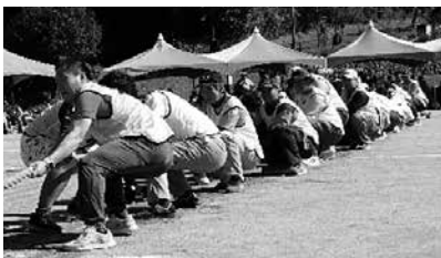
▲みんなで力を一つに！