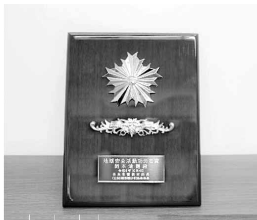
▲地域安全活動功労者賞