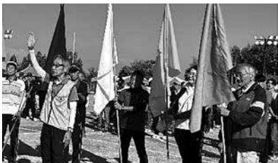
▲第3ブロック長による選手宣誓