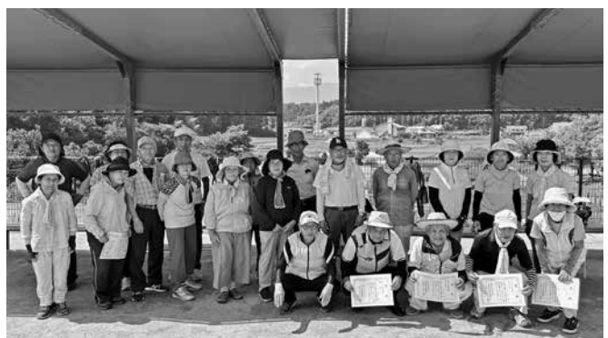
▲たくさんのご参加、ありがとうございました！