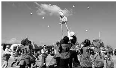
▲ちびっこおじゃま玉入れ