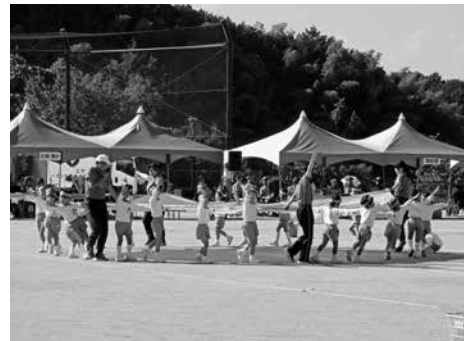
▲明日香幼稚園 公開演技