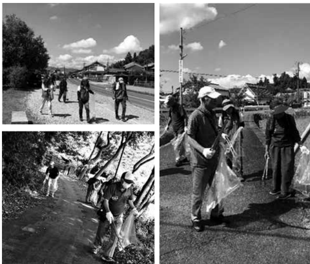
▲(左上) 橘寺周辺 (右) 飛鳥駅周辺 (左下) 石舞台古墳周辺