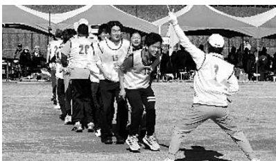
▲息を揃えてジャンプ！