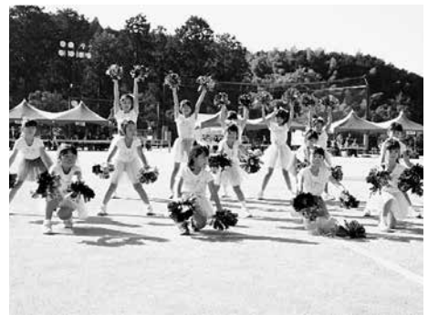
▲楽スポあすか 新体操教室