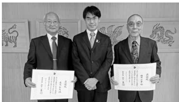
▲左から 飛鳥氏、山下知事、脇田氏