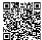
▲ Web 予約フォーム

*就学前お子様の預かりが必要な方は申込時にお申し出ください。Webで申し込みの方は、フォームにて回答してください。