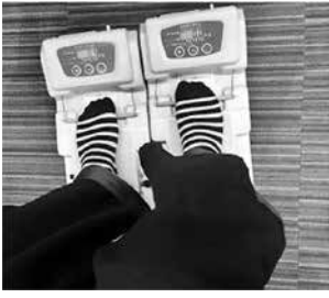
▲足の指の力を測ってみよう