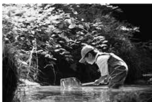
▲飛鳥いきもの調査隊「水辺トラップ」