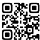
▲「あすかのサマバケ」HP