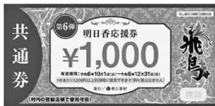
▲村内全登録店舗で使用可能な「共通券」