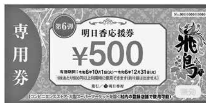
▲コンビニエンスストア・大型スーパーマーケットを除く村内登録店舗で使用可能な「専用券」