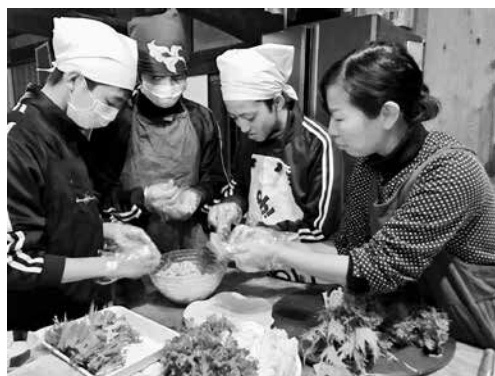
▲食事づくりをするホストファミリーと参加者