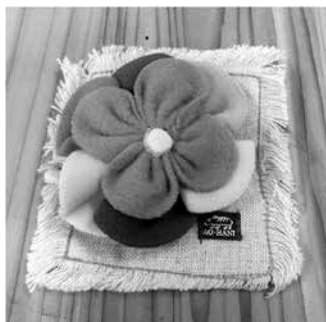
▲フリース端切れでお花のブローチ(イメージ)