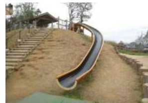
近隣公園 子どもの遊び場