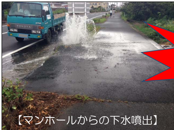
【マンホールからの下水噴出】

【原因】 雨水を流す雨樋などの排水が、「污水管」につながれていることや雨天時に汚水ますの蓋を開けて宅内の雨水を排水していること等が原因です。