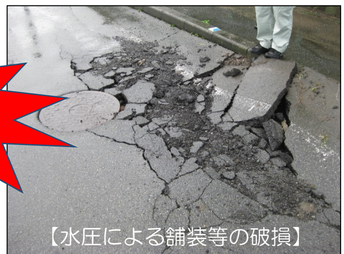
【水圧による舗装等の破損】