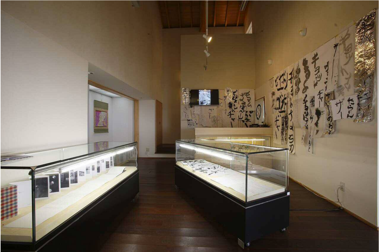
※ カフェスペース 昨年度の展示の様子（楠本 衣里佳）