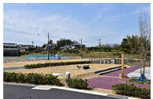
■ 住宅地の雰囲気 (北から)