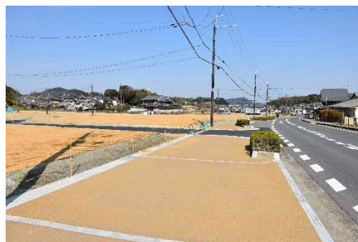
■ 店舗等用地 (南東から)